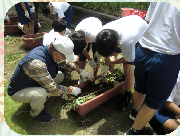
桂台中学校の生徒さんと菊の苗を植えました。

イトーヨーカドー桂台店や桂台地域ケアプラザの入り口にきれいな菊が咲いていたのをご覧いただきましたでしょうか。『みんなで栄区の花「菊」を育てる会』を中心に、地域の方、桂台中学校の個別支援学級の生徒さん、朋やサポートセンター径のメンバーさん、友好交流都市（青森県 南部町・山形県 高畠町）が交流しながら、菊を育てる活動をしていらっしゃいます。桂台地域ケアプラザとしてその活動をサポートさせて頂き、今年度は初めての食用菊育てや青森県南部町とのZoom交流もありました。このような素敵な活動をされている『みんなで栄区の花「菊」を育てる会』をご紹介します。