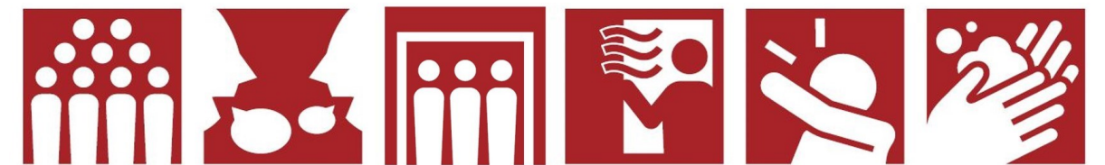
密集回避 密接回避 密閉回避 換気 咳エチケット 手洗い

冬場は寒くなり、ご自宅でも換気の手が減ってしまう方も多いのではないのでしょうか。1時間に2回以上換気を行うことが推奨されています。できれば、開放する窓は2方向とし、窓が1方向しかない場合には、ドアを開けると効果的です。上手に暖房器具を使いながら、意識して換気の時間を作るようにしていきましょう。