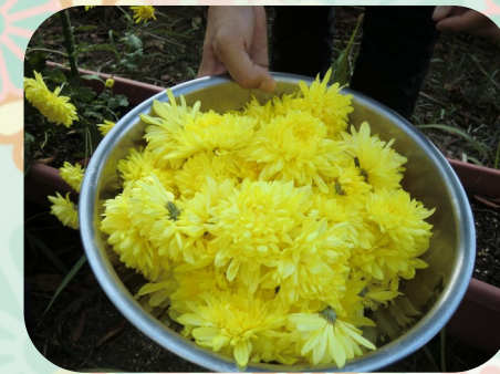
食用菊がきれいに咲きました！