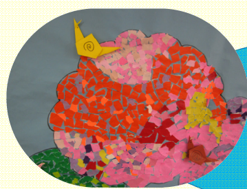
色鮮やかな紫陽花とカタツムリも一緒に