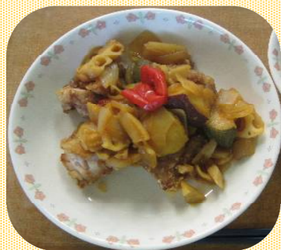
鶏肉と野菜の 黒酢あんかけ

鶏の唐揚げと野菜に黒酢のあんをかけたメニューです。まだまだ残暑厳しい中ですが、お酢を使っている事でさっぱりと食べられて、食欲もそそられ、美味しかったです。