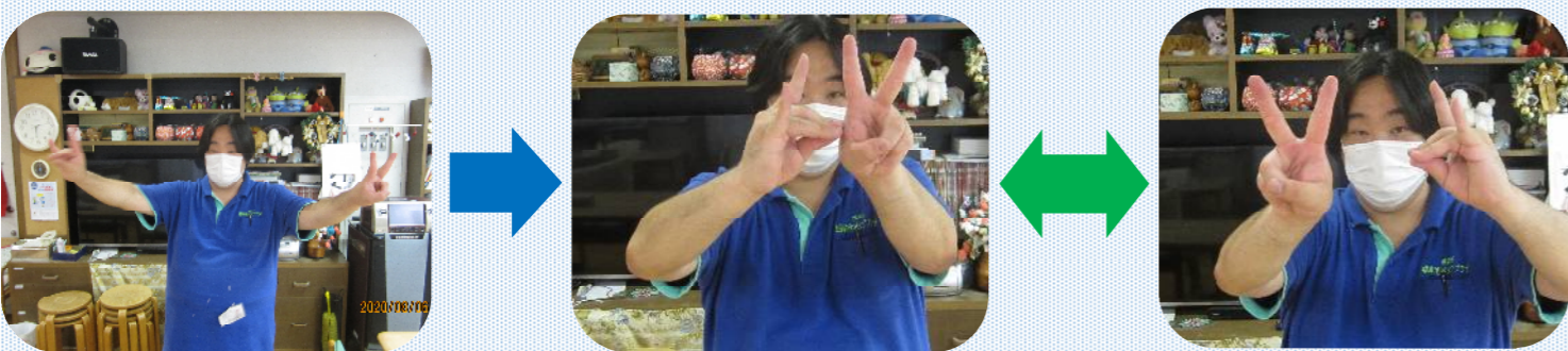
もう片方の手はきつねのサイン

両手を開いて胸の前で交差させます 交差させながら左右の手のサインを入れ替え、繰り返します とても単純ですが、なかなか難しく、「両手が一緒のサインになってしまう」「途中で腕を止めてしまう」等の感想が聞かれましたが、皆さん、楽しみながらトレーニングに取り組んで下さっていました。