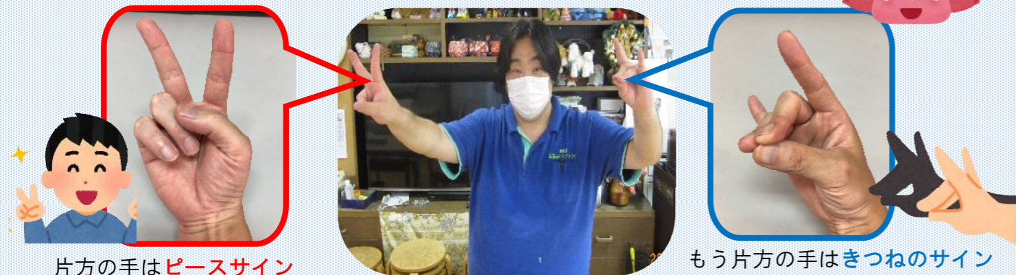
片方の手はピースサイン

ケアプラザでは帰りの時間の前に、皆さんに簡単な脳トレーニングに取り組んで頂く『脳トレタイム』を実施しています。今回は最近、取り上げたプログラムをご紹介します。 とても簡単なプログラムですので、皆さんもお試しく下さい！！