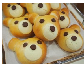
感謝祭期間中は定番の来店記念プレゼントに加え、小さなお子様向けの企画も予定しています。