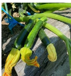
収穫できるまで大きく育ったズッキーニ。

みなさん、いかがお過ごしでしょうか？屋上庭園では夏野菜がグングンと育っています。特にボリューム感が出ている初挑戦のズッキーニは、巨大な葉を茂らせています。屋上庭園では野菜だけではなく、花も育てています。これからの成長が楽しみです。(板宮)