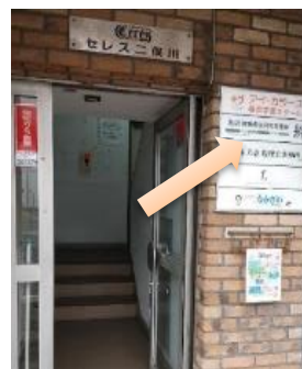
後見的支援室の名前は「絆。」この建物の5Fになります。看板があるので見逃さないくださいね。

後見的支援事業は、地域の方との繋がりを通じて登録者の方が安心して生活できる地域づくりを目指しています。 (一戸)