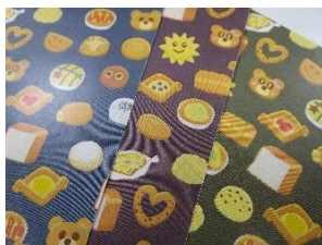
パンの細かな所までリアルに再現！色合いにもこだわった見事な仕上がりになっています。

そんなおりがみの新作情報が解禁！ こんがり工房とのコラボ柄が登場します。ご期待ください。(平山)