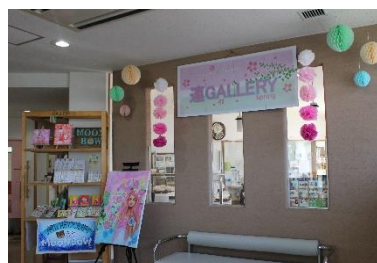
「連・GALLERY」は地域の方々の作品を中心に展示しています。年々規模が大きくなってきたイベントです。