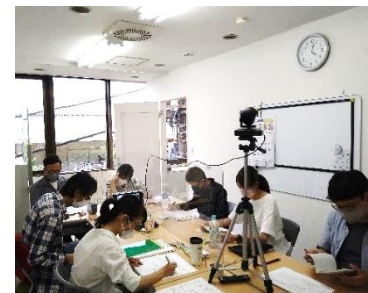
障害のある人が生活しやすい地域づくりについて、毎週話し合いを重ねています。