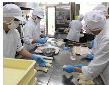
こんがり工房の美味しいパンは僕らが朝から仕込んで焼きたてを提供しています。