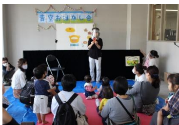
地域の親子さん向けミニイベント「お話し会」も密を避けて駐車場スペースで行っています。

おもちゃ文庫利用者である地域の親子さんを中心にミニイベントを開催し、連の利用者さんと一緒にご参加いただいています。連が開放的な施設であることをアピールすると同時に、同じ地域で暮らす仲間同士の交流を深めていただくことが目的です。地域のお子様たちにも小さいころから障害のある方や車椅子を利用している方を身近に感じていただくなど、地域活動ホームとして