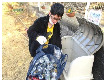
毎週木曜日は自治会のお宅に回収にでかけます。

日中活動支援事業は、さまざまな活動を通じて地域とのパイプ役を目指しています。(成田)