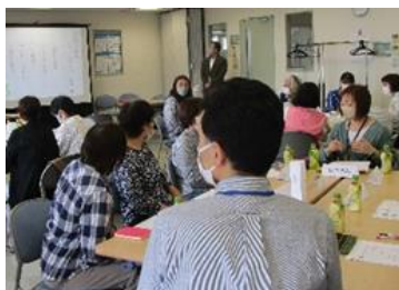
総勢24名で「集う会」を開催。 「お互いの想いを知る」をテーマに、グループに分かれて話し合いました。

今年度は多くの方にこの制度を知っていただくために、地域の拠点となる地域ケアプラザや地域の中で見守りを実践されている民生委員の方々への説明会も実施しています。「あんしんキーパー集う会」も開催し、あんしんキーパー・登